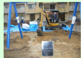
県営住宅柴宮団地内 児童遊園の除染の様子