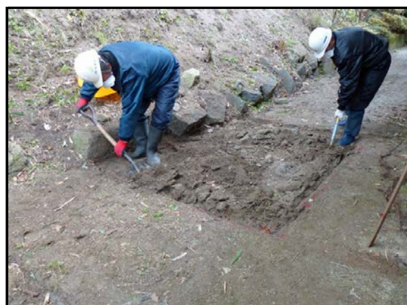
夏井地区除染作業