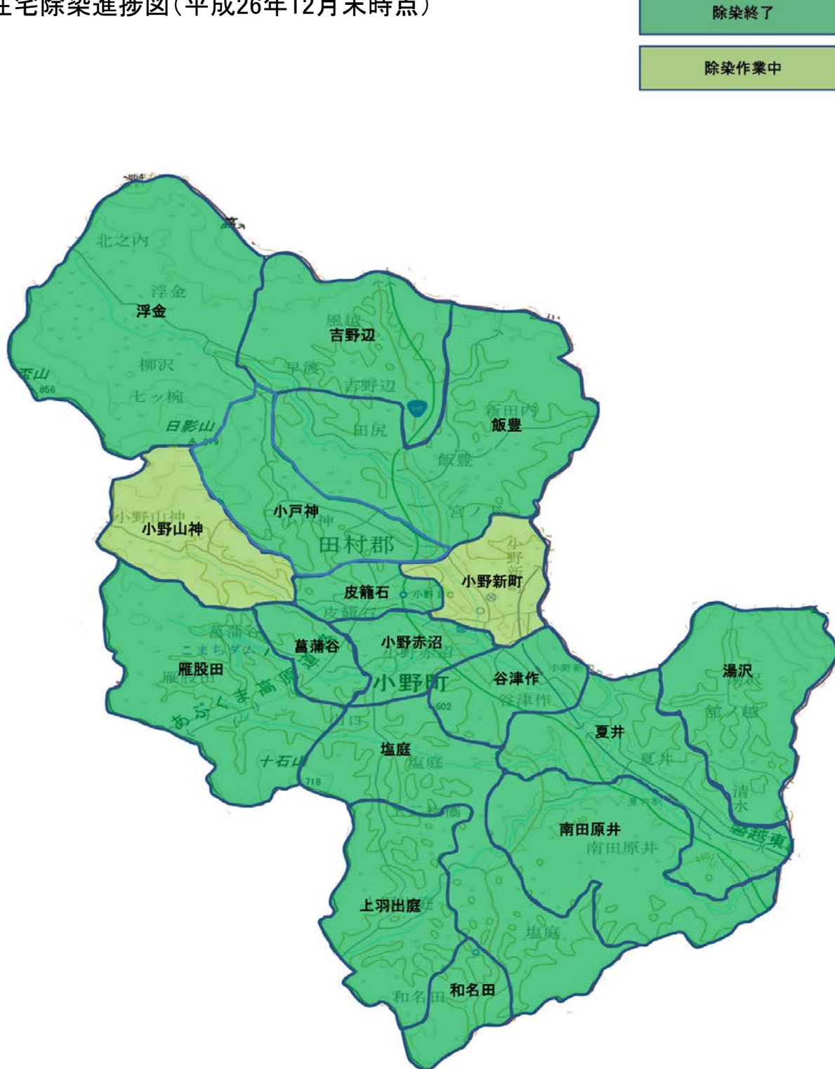
住宅除染進捗図(平成26年12月末時点)