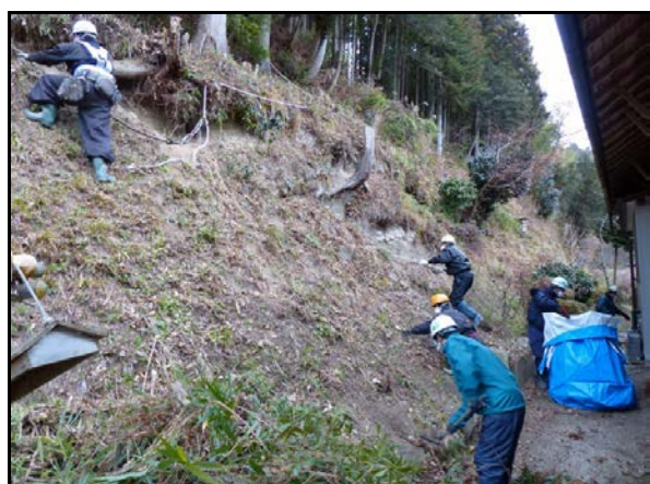
夏井地区除染作業