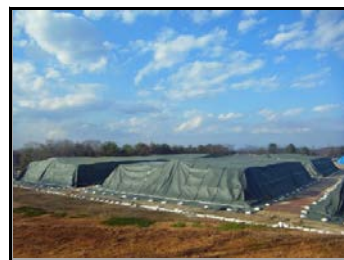
陸上競技場仮置場