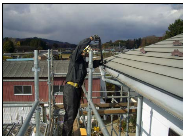
縦樋除染作業状況