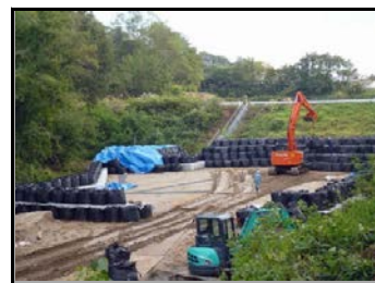
周辺を遮へい土のうで覆い、除去土壌等を据付