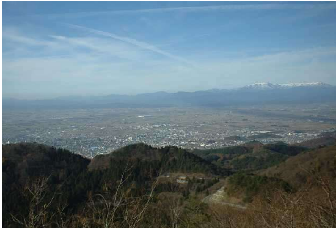
背あぶり山から見た会津盆地

1 2 3 4 5 6 7 8 9 10 11 12 13 14 15 16 17 18 19 20 21 22 23 24 25 26 27 28 29 30 31 32 33 34 35 36 37