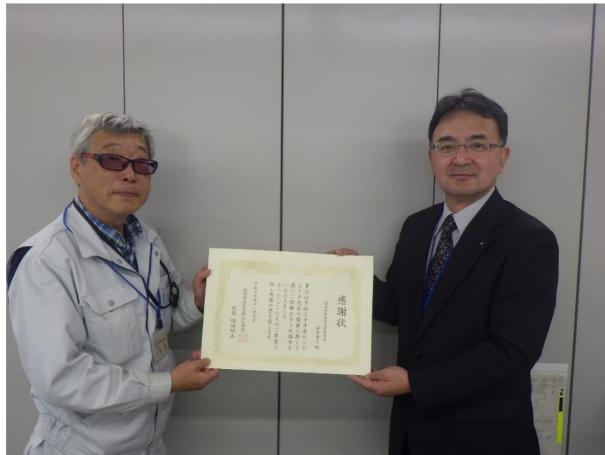
東副主査 (工事担当者)