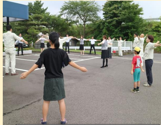
ラジオ体操に参加している様子

従業員の子供達が親の働く職場を見学し写真撮影してもらった取り組み。朝のラジオ体操から参加してもらい説明を交え建設業の仕事の重要性を体感してもらいました。