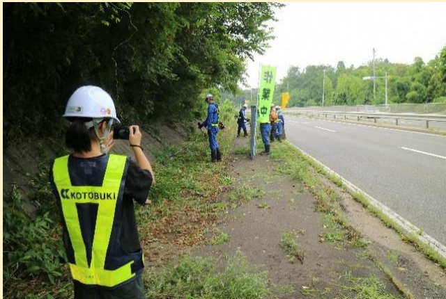
興味津々に親が働いているところを撮影している様子