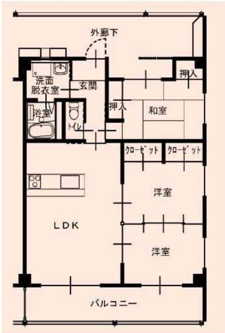
3LDK 一般仕様 (201, 202, 203, 204, 301, 302, 303, 304)