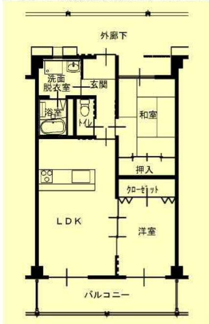
2LDK 高齢者仕様(102, 103, 104)