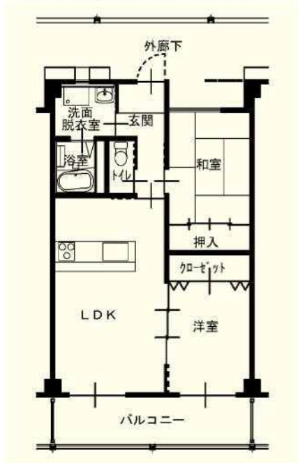
2LDK 一般仕様 (202, 203, 204, 302, 303, 304)