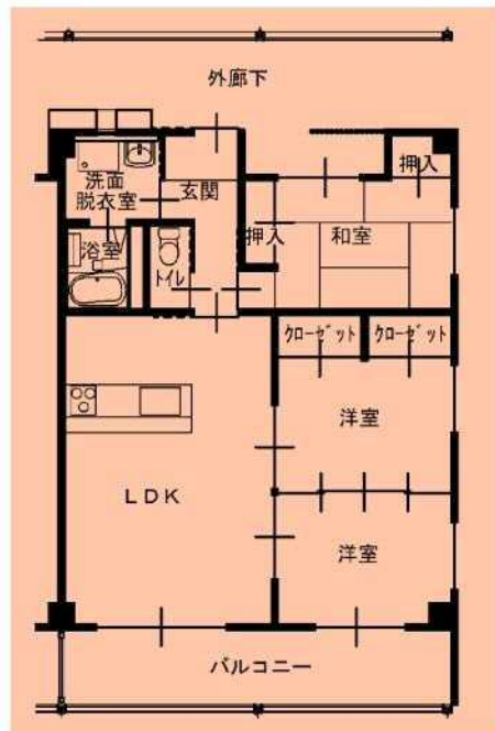
3LDK 高齢者仕様(102, 103, 104)