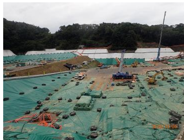
下流側埋立地の埋立状況の確認