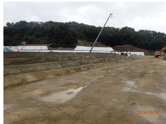
土堰堤の築堤状況の確認