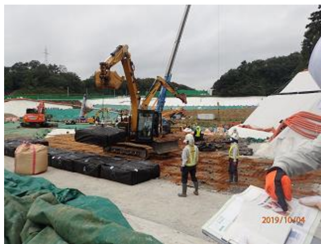
下流側埋立地の埋立状況の確認