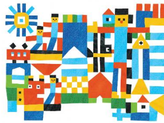
<デザインフラッグ「アイランド」>