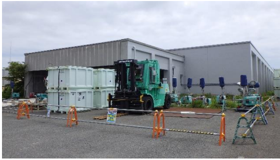
(写真1) 固体廃棄物貯蔵庫第2棟の外観