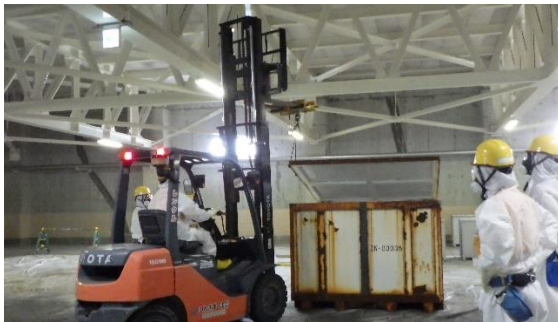
(写真2-1) コンテナの蓋の開放作業の状況