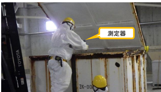
(写真2-2) コンテナ内部の線量率測定の様相