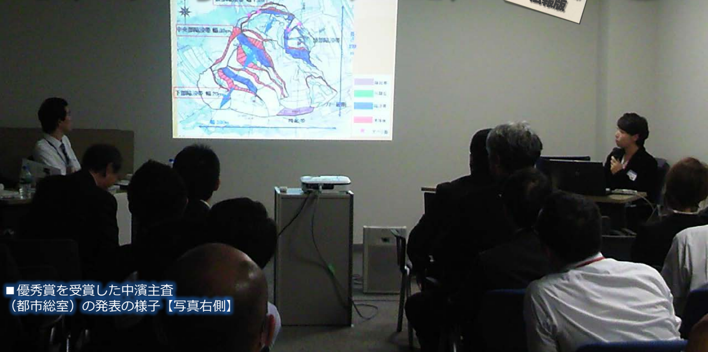
■ 優秀賞を受賞した中濱主査 (都市総室) の発表の様子【写真右側】