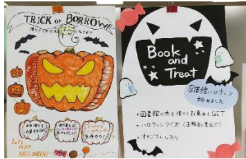
生徒作成ポスター