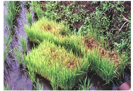
図2: 置き苗から発生したいもち病

会津での葉いもちの初発は6月下旬です。移植時の箱処理剤や散布剤等で適切に防除しましょう。また、感染源となる補植用置き苗は早急に処分しましょう（埋却する等）。