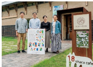
はじまりの美術館の皆さん(猪苗代町)

はじまりの美術館は築約140年の元酒蔵「十八間蔵」を改修し、2014年6月にオープンしました。年に3～5回ほどさまざまなテーマで企画展を開催し、さまざまな活動を通して「みんなが安心して暮らせる社会をどう実現するか」を一緒に考えます。また、地域の活性化につながる活動として町民の方と話し合う「寄り合い」を開き、まち歩きマップの制作やマルシェ、ワークショップなどを行ってきました。はじまりの美術館は来年でオープンから10年の節目を迎えます。これまでの経験を生かし、これからも常に新しいことが「はじまる場所」として、ひとつ、ひとつ、実現していきます。