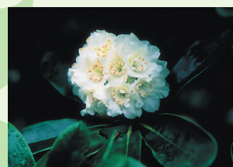
県の花：ネモトジャクナゲ