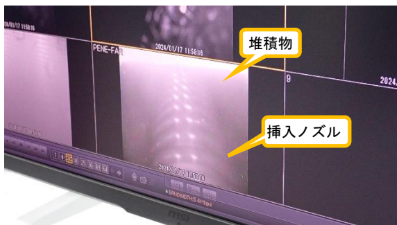
(写真2) 挿入ノズルを用いた低圧水による堆積物の除去作業の状況