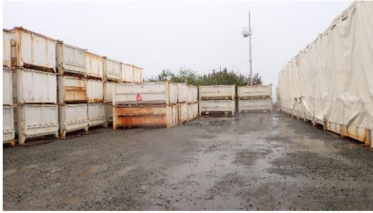
(写真3) 一時保管エリアWの奥側（東側）の 状況