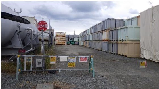
(写真1-1) 一時保管エリアW入口付近の状況 (令和4年10月24日撮影)