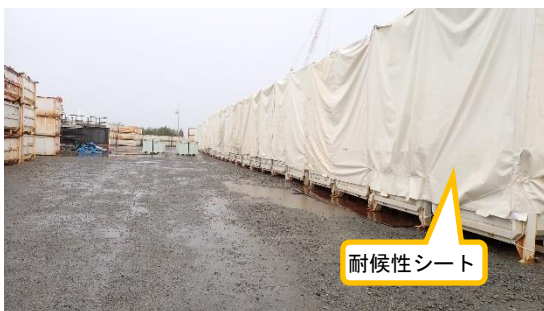
(写真2) 一部のコンテナにおける耐候性シートの設置状況