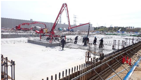
(写真3-3) 固体廃棄物貯蔵庫第10棟 (C棟) 基礎設置のためのコンクリート打設 作業状況 (北西側から撮影)