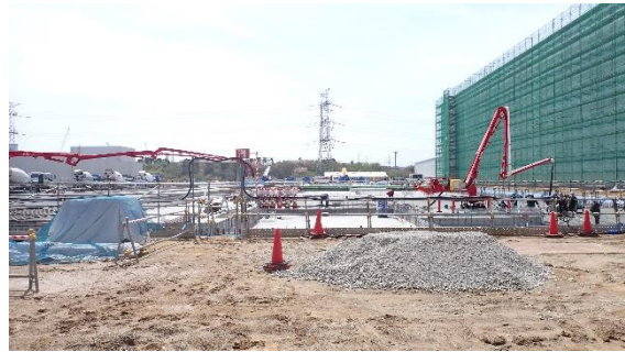
(写真3-2) 固体廃棄物貯蔵庫第10棟 (C棟) 建設予定地の状況 (北側から撮影) (令和6年4月11日撮影)