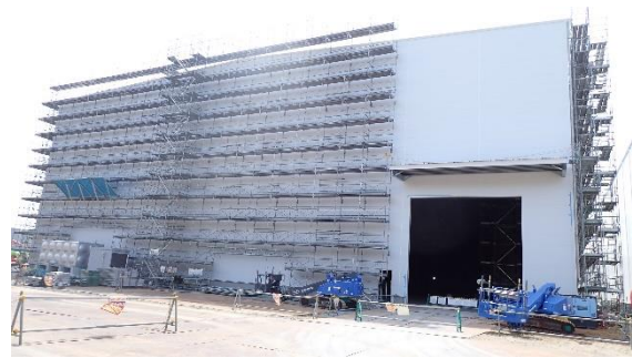
(写真 2 - 2) 固体廃棄物貯蔵庫第 1 0 棟 (B 棟) 建設予定地の状況 (北側から撮影) (令和 6 年 4 月 1 1 日撮影)