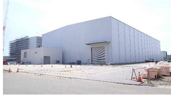
(写真 1 - 2) 固体廃棄物貯蔵庫第 1 0 棟 (A 棟) 建設予定地の状況 (北西側から撮影) (令和 6 年 4 月 1 1 日撮影)