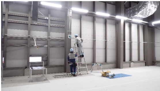
(写真 1 - 3) 固体廃棄物貯蔵庫第 1 0 棟 (A 棟) 建屋内における通信設備の設置作業 状況