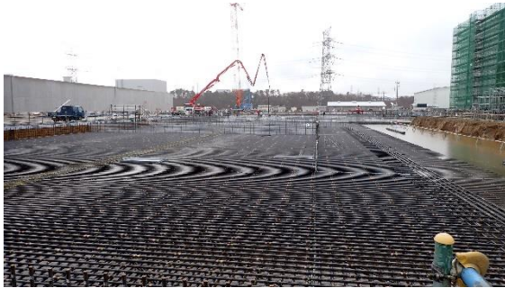
(写真3-1) 固体廃棄物貯蔵庫第10棟 (C棟) 建設予定地の状況 (北側から撮影) (令和6年1月22日撮影)