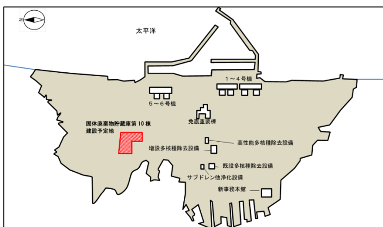
(図1) 福島第一原子力発電所構内概略図