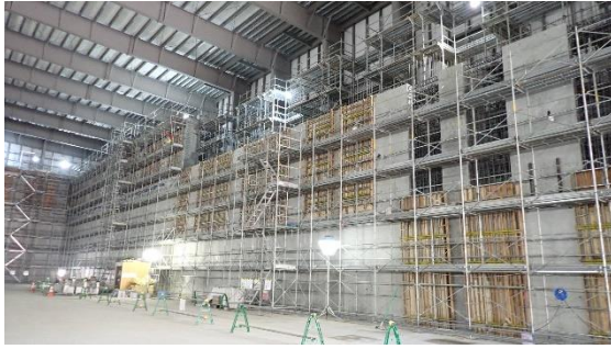
(写真2-3) 固体廃棄物貯蔵庫第10棟 (B棟) 建屋内におけるコンクリート製遮へい壁の設置作業状況