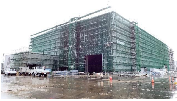
(写真 1 - 1) 固体廃棄物貯蔵庫第 1 0 棟 (A 棟) 建設予定地の状況 (北西側から撮影) (令和 6 年 1 月 2 2 日撮影)