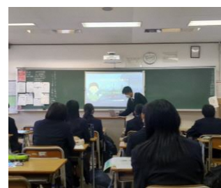
2. 企業見学後、学んだことについてグループで校内発表