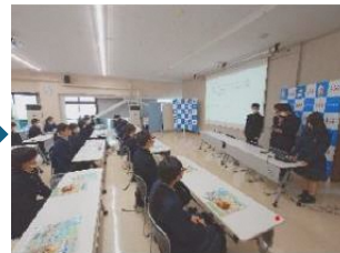
2. 訪問先企業で、与えられた課題についてプレゼンを行い、意見をもらう