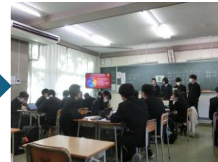
3. 見学で学んだことをもとに、内容をブラッシュアップし、校内で発表