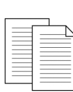
1. 事前に企業より課題を与えられる