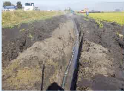
湧水処理施工状況