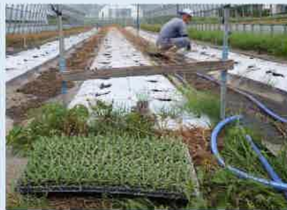
かすみ草苗植え状況