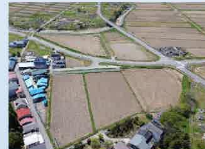
地区西側上空 北から南を撮影