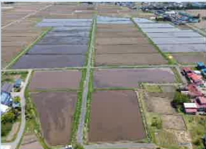
地区上空 西から東を撮影