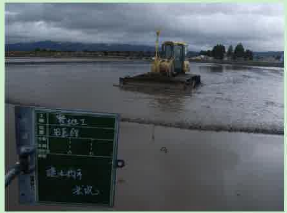
レーザーブル (ICT) による表土整地状況