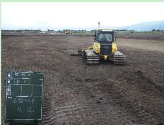
レーザーブル (ICT) による基盤整地状況