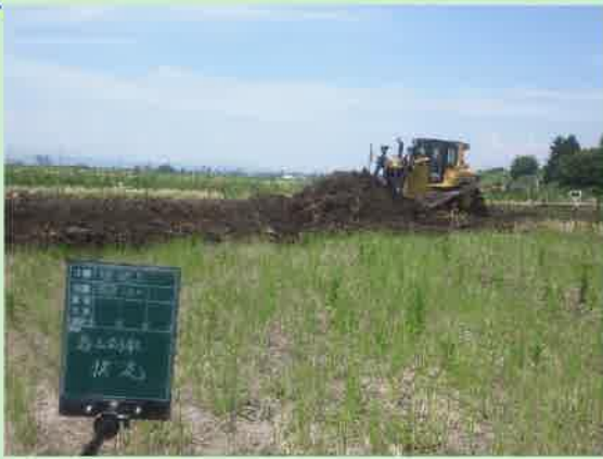
表土はぎとり状況