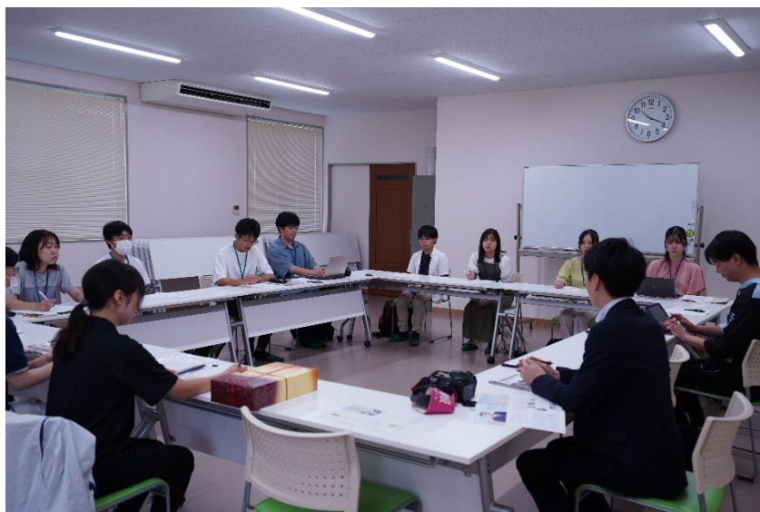
図3 JA 福島さくらでの質疑応答の様子