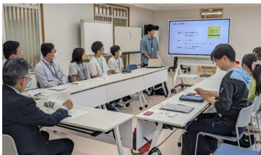
図2 三春町役場訪問の様子

当日は、はじめに三春町役場を訪問し、三春町の坂本浩之町長と役場（企画政策課）職員の方々に対して本プロジェクトと弊社について紹介した。役場職員の方々はとても温かく迎え入れてくださり、本プロジェクトに期待し、応援してくださっている姿が印象的であった。