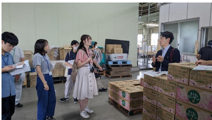
図4 ピーマン選果場見学の様子

その後は、JA 福島さくらのピーマン選果場を見学させていただいた。ピーマン一つ一つを人の目で確認し、機械でサイズ毎に選別して袋詰め・箱詰めする様子を見せていただいた。さらに、ここには生産者が一次選別したものが運びこまれ、それを選果場でもチェックするというダブルチェックを行っているため、とても品質の高いピーマンを出荷しているということや、JA 福島さくらの若手農家を支援する取り組みについても教えていただき、大きな学びを得ることができた。