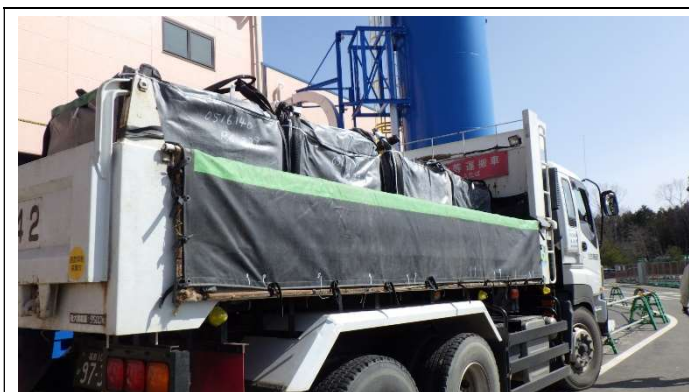
セメント固型化物を積んだトラック 異常なし。