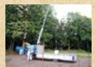
小型クレーン など