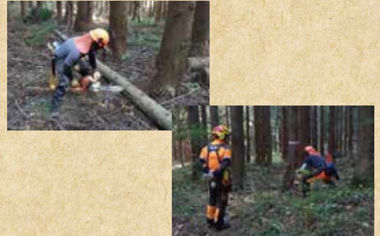
インターンシップの様子

就職ガイダンスは4,8月の年2回開催し、様々な企業から直接話を聞く機会があります。インターンシップは7,10,1月の年3回(計21日)実施し、林業に対する理解を段階的に深めるとともに、自分に合う就職先をじっくりと考えて選ぶことができます。