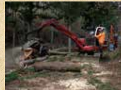
造材機械操作実習(プロセッサ)