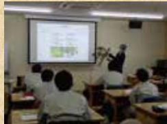
森林・林業の基礎