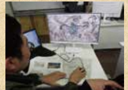
路網設計支援ソフト「FRD」