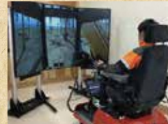
ハーベスタシミュレーター