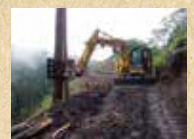
フェラーバンチャ