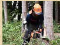
チェーンソー伐木造材技術