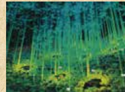
森林3次元計測システム「OWL」