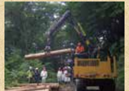
集材機械操作実習(フォワーダ)