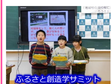
ふるさと創造学サミット