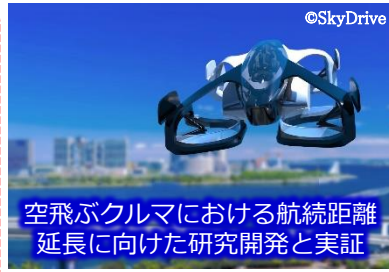
空飛ぶクルマにおける航続距離延長に向けた研究開発と実証