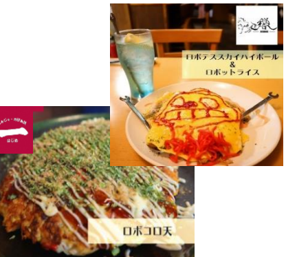
○ロボテスコラボ商品の販売