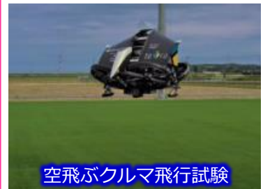
テトラ・アビエーション(株)の飛行試験の様子