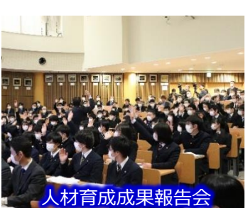
人材育成成果報告会