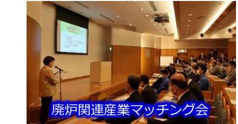
廃炉関連産業マッチング会