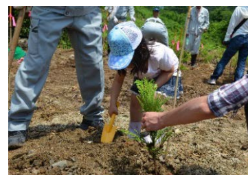
森林づくり活動での少花粉スギの植栽