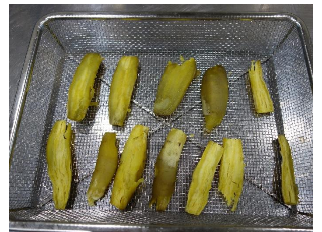
使用例 干芋の試作