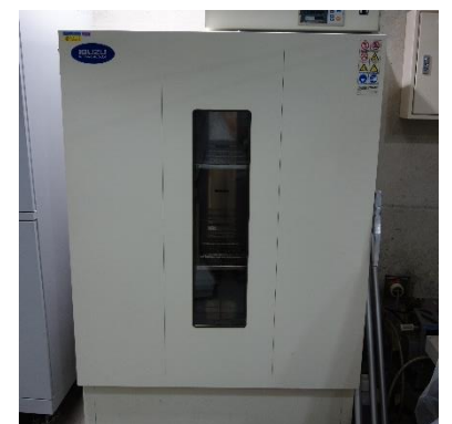
循環送風式乾燥機 (200円/時間)

○その他の施設・設備は、福島県ハイテックプラザ 施設・設備データベースからご覧いただけます。