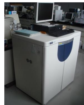
高速アミノ酸分析計 (3,080円/時間)

○その他の施設・設備は、福島県ハイテックプラザ 施設・設備データベースからご覧いただけます。