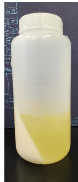
甘酒の遠心分離《後》