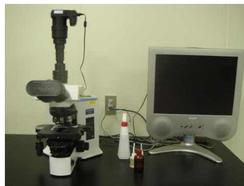
微生物顕微鏡 (500円/時間)