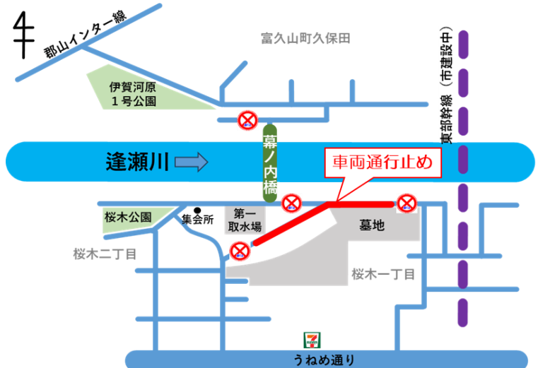
堤防道路通行止め区間図