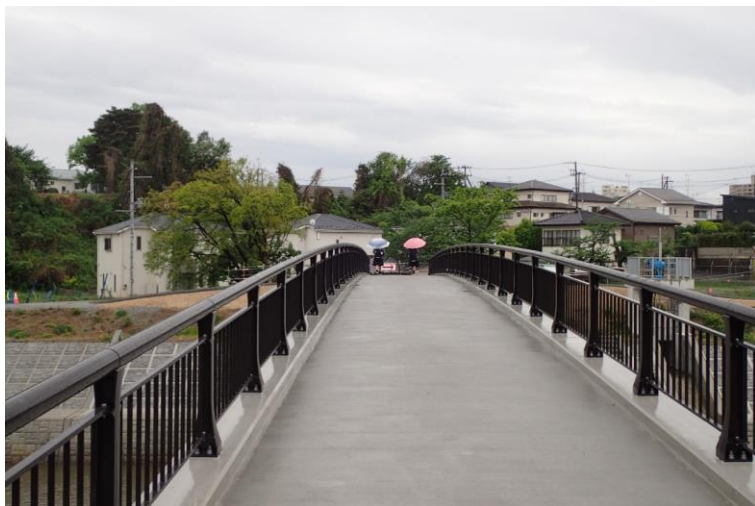
通行を再開した幕ノ内橋

令和3年2月13日に発生した地震(郡山市震度6弱)により通行不能となっていた幕ノ内橋の架け替え工事が完成し、令和6年5月2日より通行を再開しました。工事期間中は大変ご不便をおかけしました。引き続き、幕ノ内橋の周辺では護岸の工事などが行われることから、現地に設置した案内看板に従い、ご通行をお願いします。(従来どおり、歩行者と自転車のみ通行が可能です。)