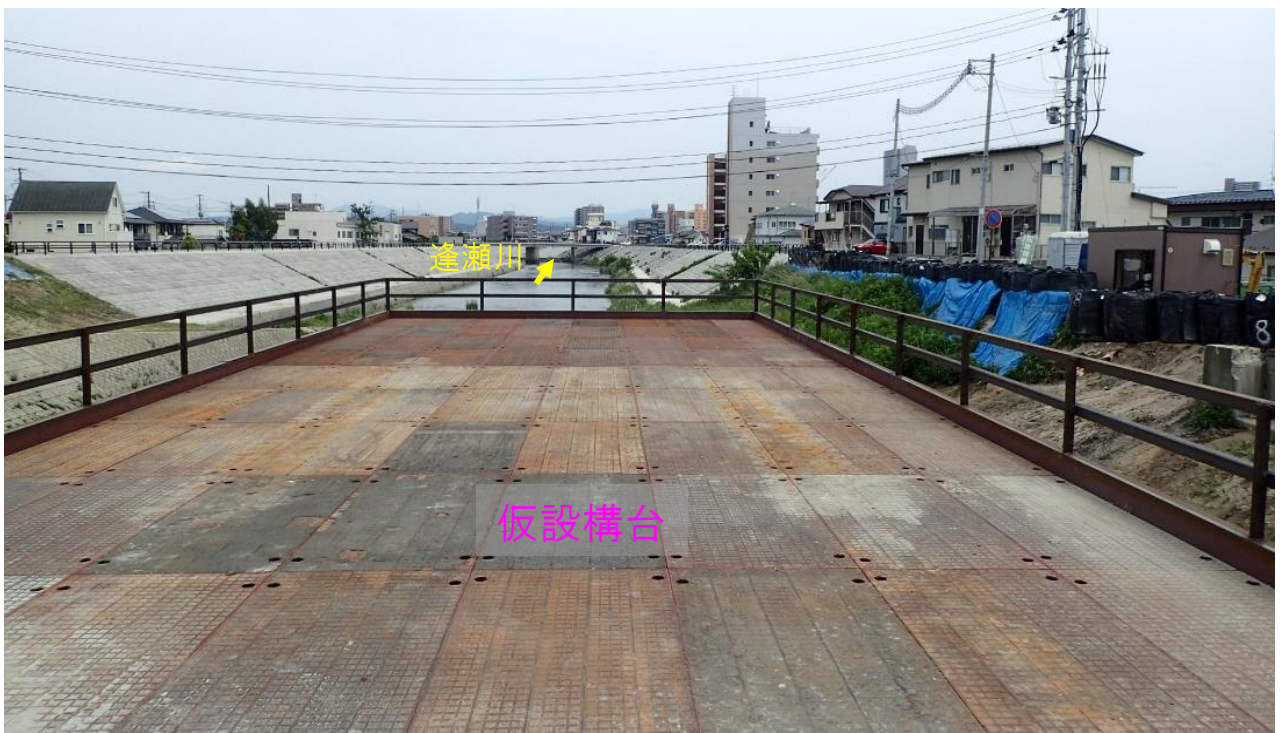
咲田橋仮設構台上の状況