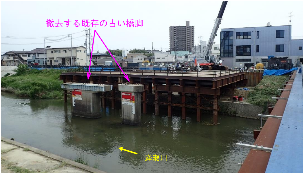
咲田橋仮設構台の設置状況

また、左岸堤防付近（富久山町側）では、新しい橋の下部工（橋台）の工事を進めていく予定です。