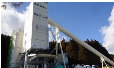
富岡生コン株式会社（富岡町）