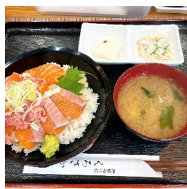
海鮮和食処くろさか（浪江町）