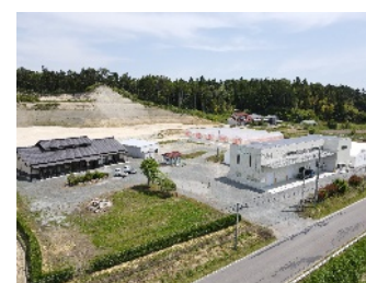
株式会社アグリ鶴谷(南相馬市)