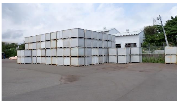
(写真2-1) 使用済保護衣等一時保管エリア a の運用管理状況① コンテナは4段積みで整頓されており、破損・荷崩れ、積載物の飛散等は確認されなかった。