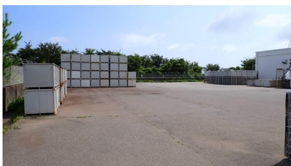
(写真1-2) 使用済保護衣等一時保管エリア a 現在状況② (エリア西端付近：西側から東側を撮影)