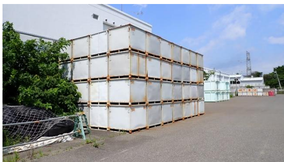
(写真1-1) 使用済保護衣等一時保管エリア a 現在状況① (入口付近：南側から北側を撮影)