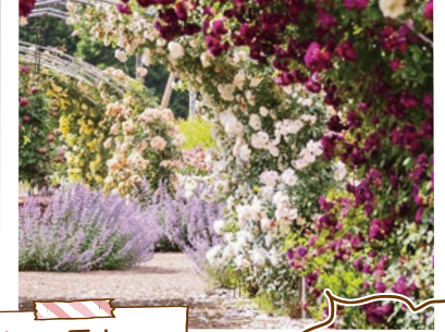
撮影地/南相馬市 (横田のバラ園)