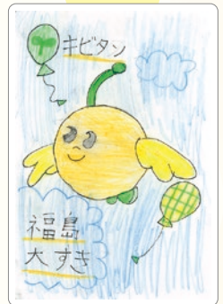
ふうせんと一緒に そら 空を飛んでいるね！