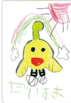
えがお 笑顔がとってもすてきな キビタン！