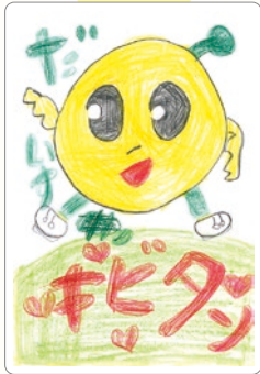
ぽちりとした ひとみ 腫がかわいいね！