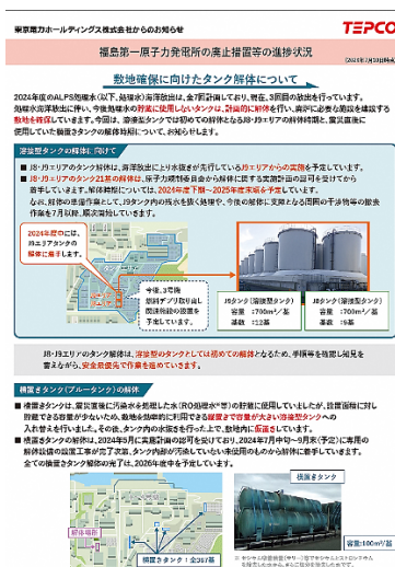
写真②廃止措置等の進捗状況