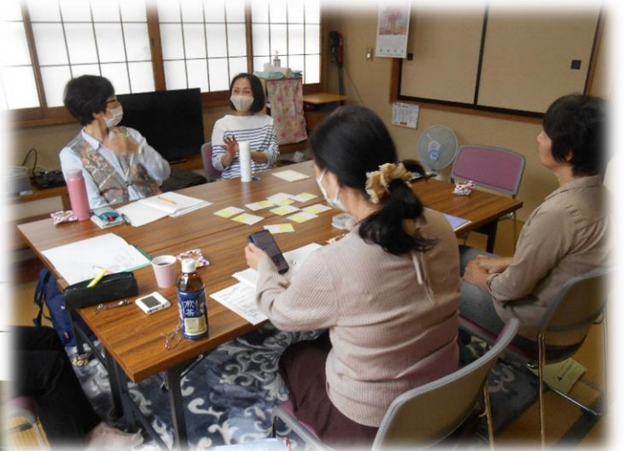
安心感に包まれて話す・聞き合う姿が見られました

絆づくりの会では、定例会以外にも活動誌を発行しています。また、子育て中の方を対象とした子育て応援サロンも実施しています。(現在はお休み中)。