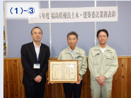
【株式会社菊地測量設計】