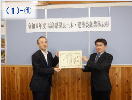
【株式会社協和地質】