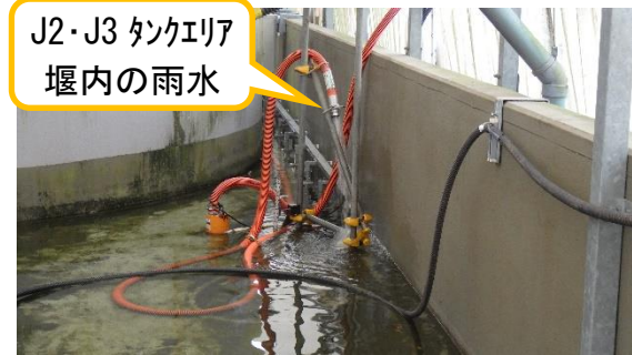
(写真 1 ②) J8タンクエリア堰内への移送