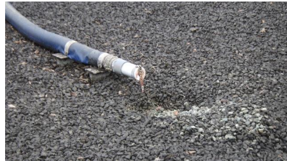
(写真 2 ②) 散水ホースの先端