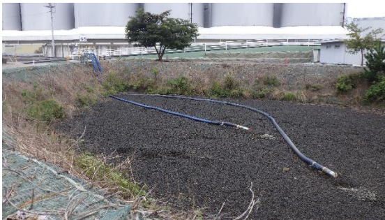
(写真 2 ①) 雨水散水場所