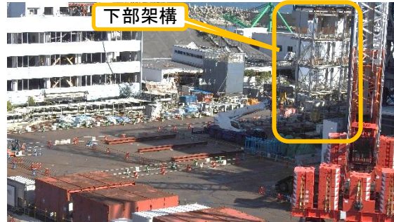
(写真2) 下部架構の構築