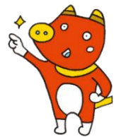
ふくしま応援！『ペコ太郎』