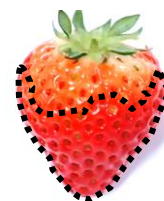
写真1 着色度70～80%の果実

樋元ら、イチゴ流通におけるリユース輸送容器の優位性及び輸送用ラックの損傷低減効果に関する研究、酪農学園大学紀要. 人文・社会科学編 35 巻 2 号, p63-85, 2011.