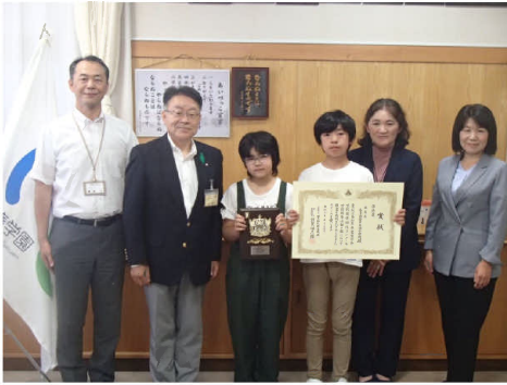
▲会津若松市立湊学園 学校林等活動の部「準特選」

令和5年度全日本学校関係緑化コンクールにおいて、会津若松市立湊学園が学校林等活動の部で「準特選」、同市立大戸小学校が学校環境緑化の部で「入選」に輝き、星所長より賞状の伝達を行いました。