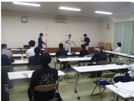
▲森林測量基礎の講座