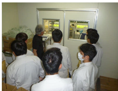
▲工場見学（株式会社AML植物研究所）