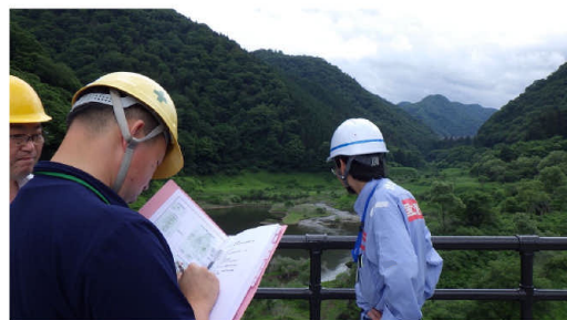
▲宮川ダム現地調査の様子