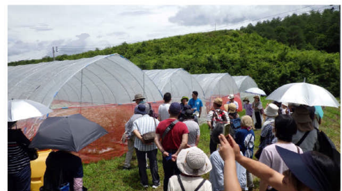
▲昭和かすみ草の畑見学

同日、フェア会場内では、かすみ草プロジェクト※の一環で当所共催の「真夏のかすみ草ウィーク」も開催し、昭和村が誇るGIブランド「昭和かすみ草」の魅力を存分に紹介しました。かすみ草を使った体験イベントや、地元で開発された関連商品の販売を行い、多くの来場者が「昭和かすみ草」の魅力を再発見する機会となりました。また、地元特産品とのコラボレーション商品も好評を博し、地域全体の活性化に貢献しました。