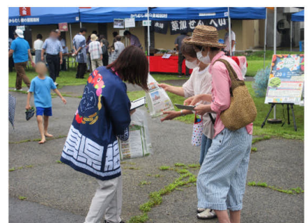
▲プレゼント配布の様子