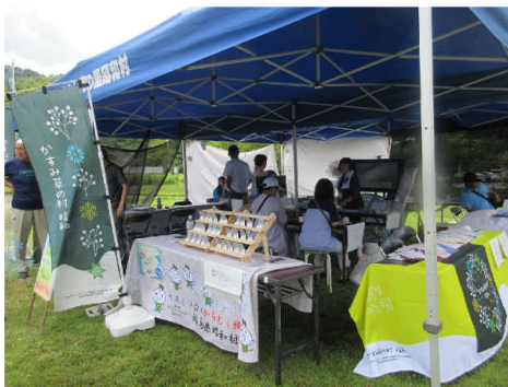
▲「真夏のかすみ草ウィーク」ブース

昭和かすみ草を知ってもらう事、かすみ草のできることを考え、かすみ草でたくさんの方の幸せを育てるプロジェクトです。昭和かすみ草を使った商品づくり、村内で昭和かすみ草を購入できる環境の整備、昭和かすみ草を使った多彩なプログラムの提供など、昭和かすみ草で村を活性化させる取組を行っています。