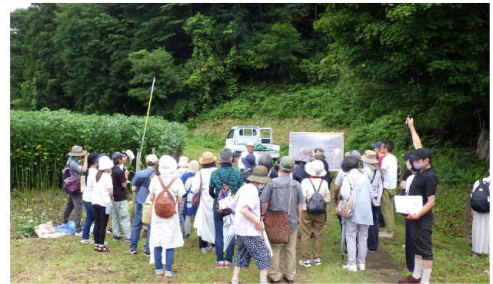
▲からむしの畑見学

まず、奥会津の自然と農業を体感できる「からむしと昭和かすみ草の畑見学ツアー」が人気を集めました。このツアーは午前と午後の2回にわたり開催され、県内外から集まった60名以上の参加者が、奥会津の豊かな自然と伝統的な農業技術を学びました。最初に訪れた大芦地区では、からむし生産技術保存協会の解説により、からむしが2ヶ月で2.4mに成長する驚異のスピードや、早朝に収穫される独自の栽培方法について学びました。続いて、矢ノ原地区のかすみ草畑を訪れ、当所職員による栽培方法やかすみ草の特有の香りを抑える処理についての説明が行われ、参加者たちは熱心に耳を傾けていました。