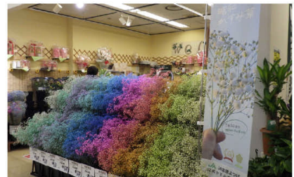
▲かすみ草フェアの売り場

会津若松市のヨークベニマル一箕町店と門田店では、毎年恒例のかすみ草フェアを7月6日～7日に開催。今年は、特別価格での販売や、関係者による店頭PRなど、大盛況のうちに幕を閉じました。