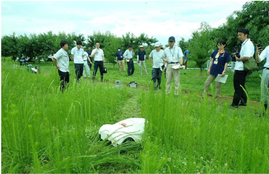
▲現地研修会の様子

会津地方の果樹農家にとって、年間5回以上の除草作業は大きな負担となっています。この課題を解決するため、令和6年7月24日、会津若松市北会津町で第1回現地検討会を開催し、リンゴ栽培者17名が参加しました。