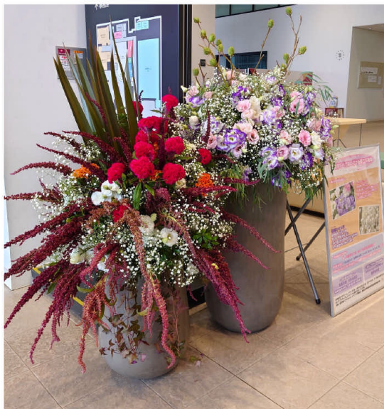
會津稽古堂の展示