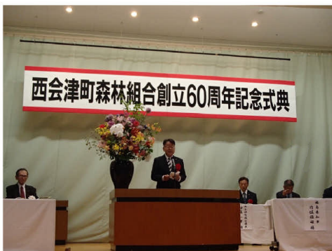
▲知事祝辞（星所長代読）

60年の歩みに敬意を表するとともに、今後も引き続き、組合員のため、そして地域の森林と地球環境を守るために、持続可能な組合経営を進めていくことが期待されます。 【森林林業部】