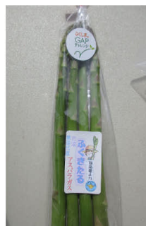
▲GAP認証会津産アスパラガス