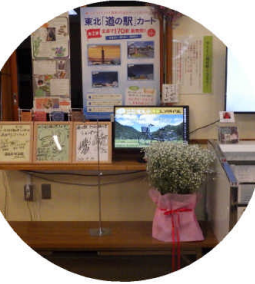
▲道の駅からむし織の里 しょうわ