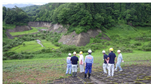
▲二岐ダム現地調査の様子