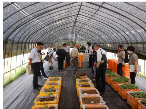
▲栽培講習会の様子