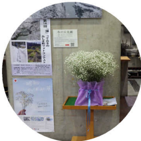
▲道の駅尾瀬街道みしま宿

奥会津4町村の道の駅では飾り花やポスター掲示を行い、多くの方に「昭和かすみ草の日」をPRしました。