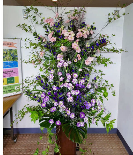
三ノ倉スキー場の展示

この機会に会津の花々を愛でて、心豊かなひとときをお過ごしください！ 【農業振興普及部】