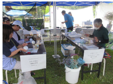
▲かすみ草を使った体験イベント