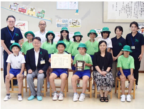
▲会津若松市立大戸小学校 学校環境緑化の部「入選」

湊学園では、児童たちが自ら学校林の整備を行い、猪苗代湖の水質調査を通して森林と水のつながりについて学ぶなど、総合的な学習に取り組んでいます。特に、猪苗代湖の水質にも着目した点が評価され、今回の受賞につながりました。