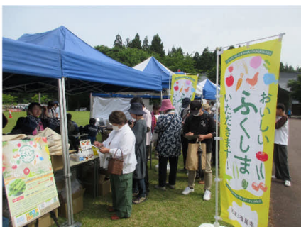
▲キャンペーンの様子