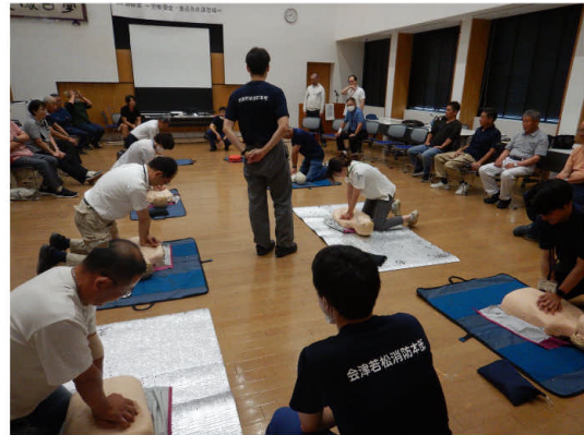
▲心肺蘇生法の実演