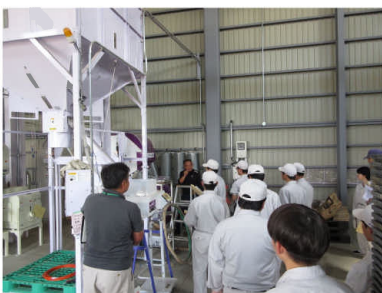
▲ライスセンター見学 (有限会社大和川ファーム)