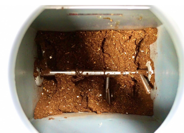
生ごみ投入後24時間 24 hours after food waste is put in

調理過程で出る食品の端材や食べ残しなどの食品残渣を、バイオ材を用いた生ごみ処理機にて堆肥へとリサイクルしてくれる処理機を導入し活用しております。約24時間ほどでほぼ形が判別しにくくなるまでになります。