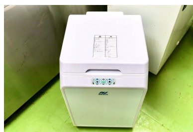
生ごみ処理機 Food waste processor