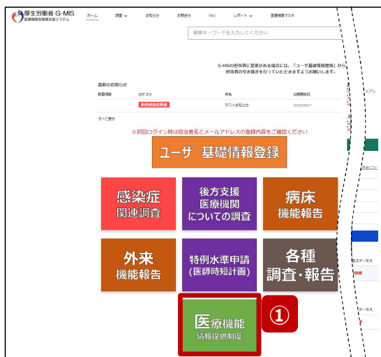
ホーム画面 (病院等)