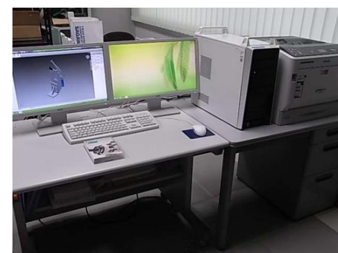
3D CADシステム (940円/時間)

○その他の施設・設備は、福島県ハイテクプラザ 施設・設備データベースからご覧いただけます。