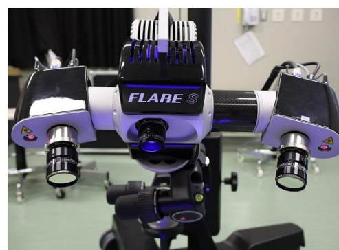
非接触三次元デジタイザ (7,350円/時間)