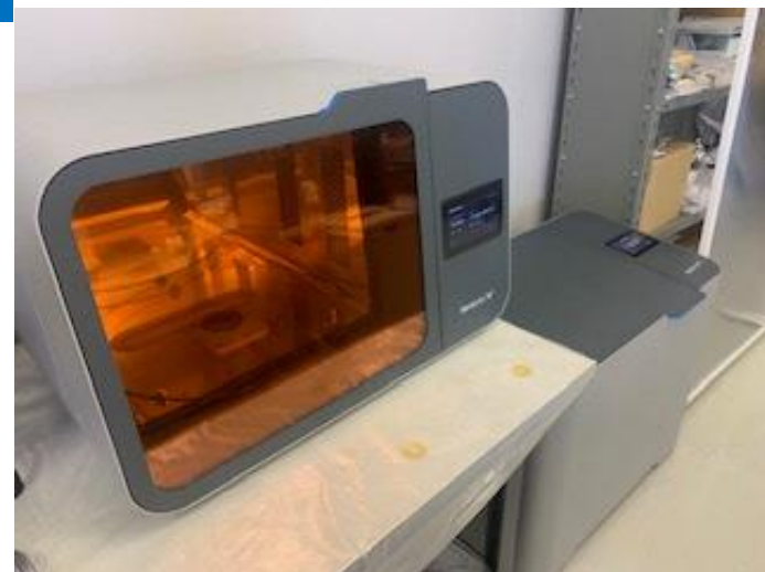
洗浄機と二次硬化機