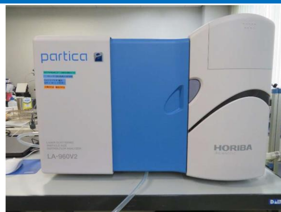
レーザー回折散乱式粒度分布測定装置 (3,020円/時間)

○その他の施設・設備は、福島県ハイテクプラザ 施設・設備データベースからご覧いただけます。