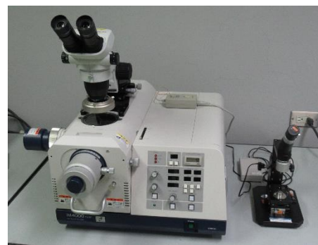
イオンミリング装置 (4,040円/時間)

○その他の施設・設備は、福島県ハイテクプラザ 施設・設備データベースからご覧いただけます。