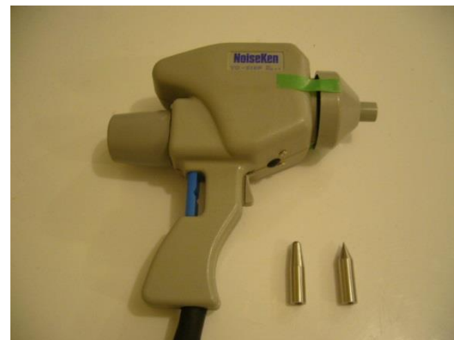
＜放電ガン及び電極＞

試験機器が人体からEUTへの静電気放電及び近傍への静電気放電による電磁波により、影響を受けないかを確認できます。