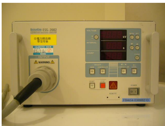
＜静電気許容度試験機 本体＞