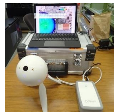
アコースティックカメラ (600円/時間)

○その他の施設・設備は、福島県ハイテクプラザ 施設・設備データベースからご覧いただけます。