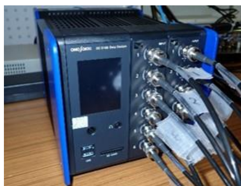
音響測定・解析システム (2,700円/時間)