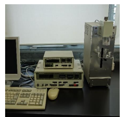
レオメーター (990円/時間)

○その他の施設・設備は、福島県ハイテクプラザ 施設・設備データベースからご覧いただけます。