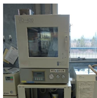
真空定温乾燥機 (200円/時間)