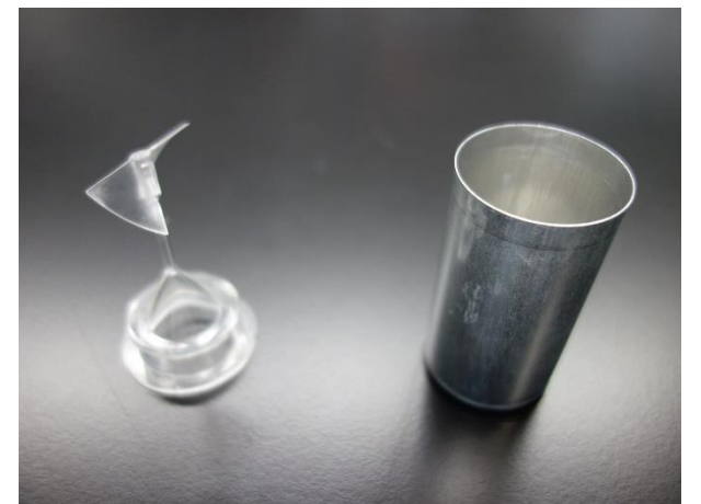
缶（左）に試料を入れ、パドル（右）をセットし測定