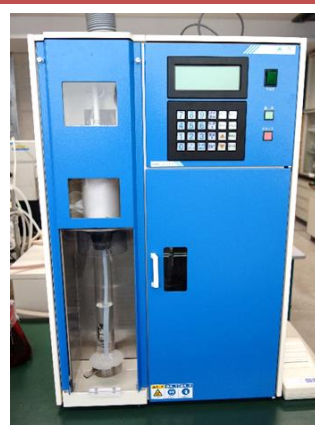
蛋白質蒸留/分解装置 (460円/時間)