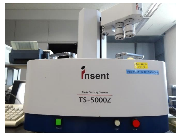
センサー取付部・アーム部分