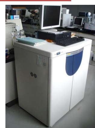
高速アミノ酸分析計 (3,080円/時間)

○その他の施設・設備は、福島県ハイテクプラザ 施設・設備データベースからご覧いただけます。