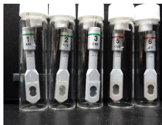
各センサー(人口脂質膜型)